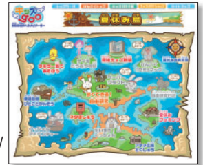
URL http://kids.goo.ne.jp/event/summer/ 運営：NTTレゾナント株式会社

夏休みといえば、子供の自由研究に付き合って頭を悩ますお父さんも多いはず。2学期直前にあわてて探すよりも、今のうちに予習しておくのが得策。