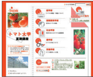
URL http://www.tomato-univ.com/ 運営：カゴメ株式会社

は「全国一斉トマトセンター試験」が実施され、誰でも自由に参加できる。上位得点者には抽選でトマトカラーのノートPCも当たるので、夏休みの間にちょっとしたトリビアを仕入れるためにアクセスしてみるのもいいだろう。