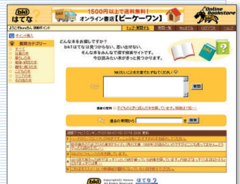
URL http://bk1.hatena.ne.jp/ 運営：株式会社ブックワン / 株式会社はてな

「bk1はてな」は、このシステムを特に「本」に特化したもの。本好きにとっては、本を読むことだけでなく、本について話すことも楽しみの1つだが「bk1はてな」なら、楽しみながらさらにポイントを稼ぐこともできる。本好きにとっては、一石二鳥のサービスだ。