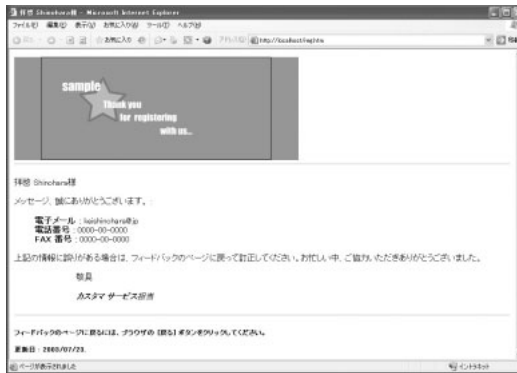
図4 作成されたFlashアニメーションをウェブブラウザで表示したところ