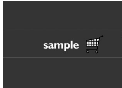
図3 DynamicFlash で選択できるFlashのタイプは2種類。タイプ1は登録ページに適したもの(左)タイプ2はショッピングサイトの会計ページに適したもの(右)