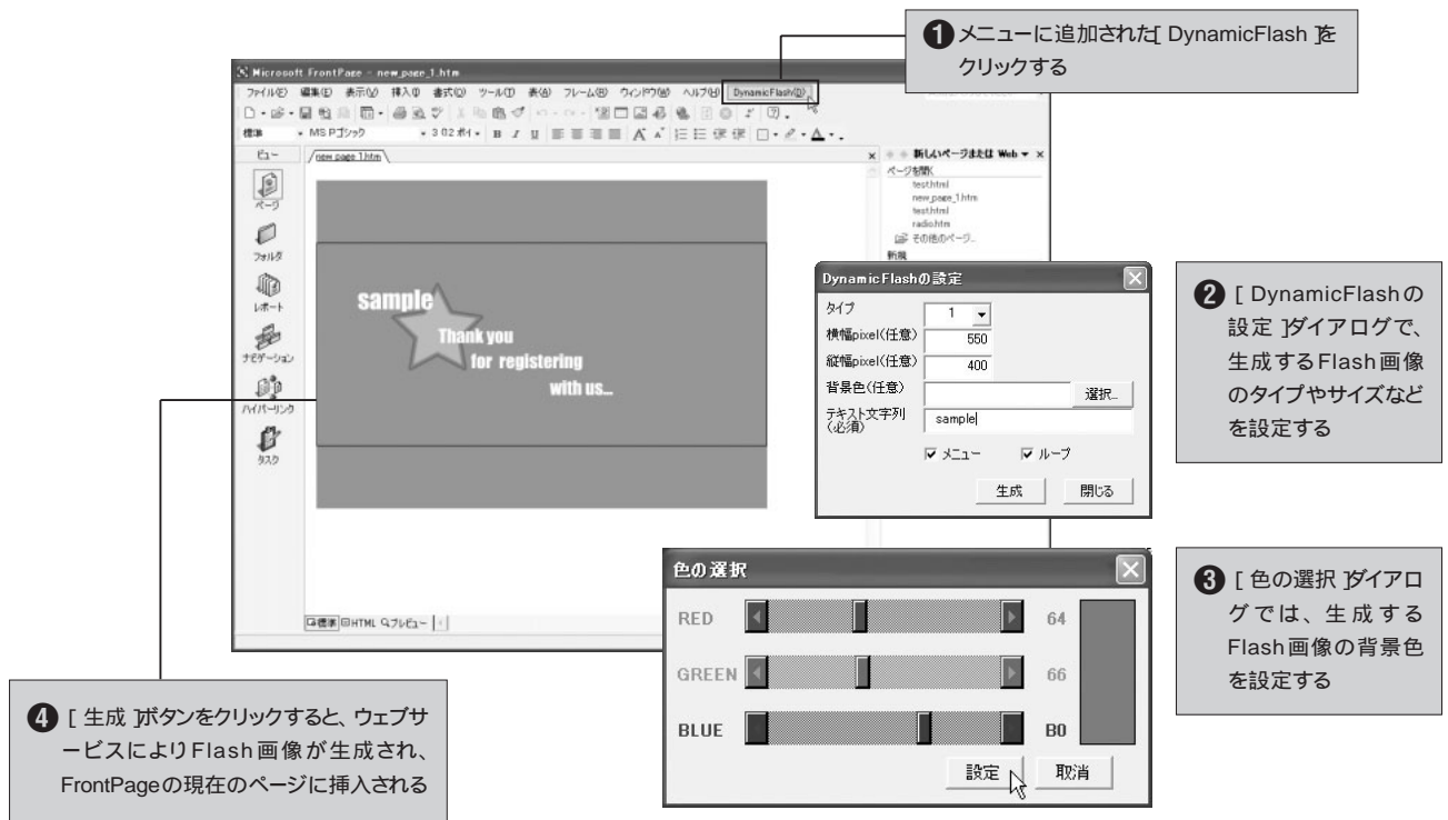
図2 サンプルプログラムの使い方

が表示される。できることは少ないが、仕様がシンプルな分、非常に使いやすなのが特徴だ。