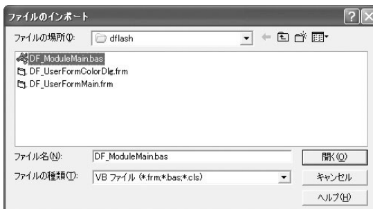
図5 [ファイルのインポート]ダイアログボックス。ファイル自体は5つあるが、実際に読み込む必要があるのはbasファイルと2つのfrmファイルだけだ