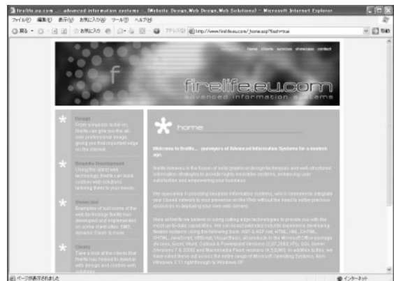
図1 ファイヤーライフのウェブサイト。図からはわかりにくいですが、ページにFlashアニメーションが利用されている

URL http://internet.impress.co.jp/im/xmlwebservices/