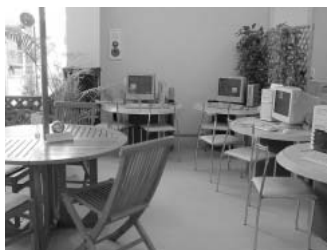
備え付けのPC。PCはここ以外にも店内のいたるところに置かれている。