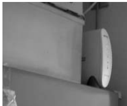
アクセスポイントは冷蔵庫の上、フロアに面した壁の裏という場所に設置した。