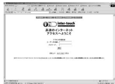
ログイン画面。無線LANを接続してブラウザを立ち上げるとこの画面が表示される。