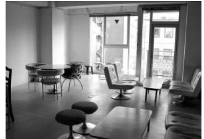
窓側の風景。向かいのビルとの距離感を実感できると思う。近いわりには向かいのビルでは電波を拾えなかった。