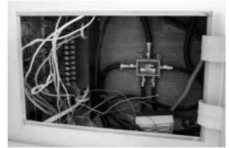
電話端子盤の中。結構ごちゃごちゃしている。