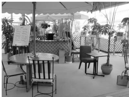
noi cafe内。席は2人掛けから10人くらい座れるテーブルまで多彩。

海浜幕張を訪れる機会がある人は行き帰りに立ち寄ってみてはどうだろう。なお、10月からは奥のスペースを改装してブックカフェとして再オープンする予定で、新聞などの書評を取り入れた実験的なカフェになるとのことだ。