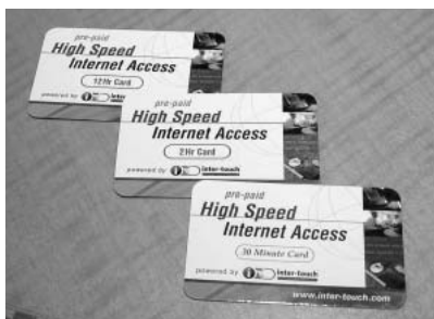
プリペイドカードのサンプル。

来年以降は彼らが手がけたIPインフラを利用して、ホテル内においてIPベースのビデオオンデマンド事業を開始する予定で、有線/無線のインターネット接続の提供だけにとどまらない新しいサービスによっても差別化を強化していくとのことだ。