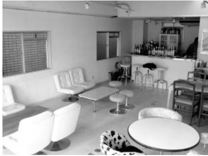
店内はこぢんまりとしている。左側の壁を使って夜はビデオアートが上映される。

ADSL以外は簡単にできてしまった無線LANスポット化は、オーナーにとってはハッピーだったようだ。アクセスポイントの金額を負担する必要がなく、約1万円するPowerBook用の無線LANカードAirMac Extremeを購入せずにPowerBookは有線で接続することにしたので、オーナーが追加で購入したのは5メートルと15メートルのLANケーブル2本だけと非常に安上がりだった(電話工事費は別)。また、図