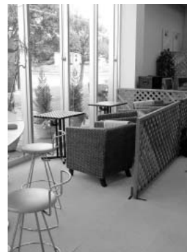
リラックスできそうなテラス側の席。

集などもできる（別料金が必要）。残念ながら無線LANからのプリンター利用はドライバーの設定などが必要になるためサービスしていないとのことだった。