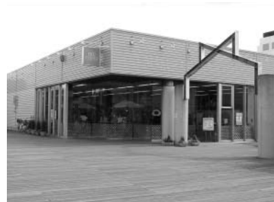
幕張メディアサーフィン。内部は講習会用のスペースもあるのでかなり広い。

noi cafeにはPCが豊富に設置されていて、ビジターとして30分210円で利用でき、プリンター（モノクロ）も使える。メールのチェック程度ならノートPCを持ち込まなくても借りたほうが楽だろう。なお、頻繁に訪れるならメンバーズカードを申し込むといい。1分6円で利用でき、カラープリンターやスキャナーの利用、ビデオ編