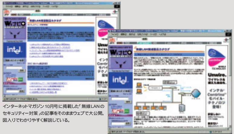
インターネットマガジン10月号に掲載した「無線LANのセキュリティ対策」の記事をそのままウェブで大公開。図入りでわかりやすく解説している。

さらに出先で無線LANスポットを検索するのなら、iモードの「iMapFan」もしくはポータブルウェブの「ロコガイド」を利用するのがいい。使い方は右に記してあるので、それに沿って、今いる場所からもっとも近い無線LANスポットを探し出そう。