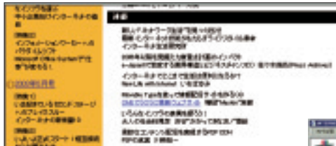
インターネットマガジンのページにアクセスし、目次をたどると「CMSでラクラク更新ウェブサイト」を発見！

インターネットマガジンの紹介ページを開き、「CMSでラクラク更新ウェブサイト」のリンク部分からサポートページにアクセスできる。この記事と連動して、Movable Typeに関する情報を中心にCMSのノウハウや最新情報を投稿するblogなので、気軽に参加してみてもいいだろう。にわかにアクセスも増えていて、まさに本誌とウェブの融合を実現したページだ。