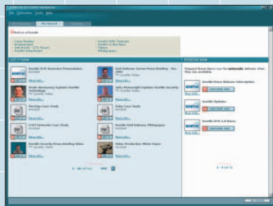
Kontiki Delivery Manager