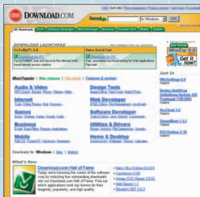
CINETの抱えるDownload.comでは配信コストを92パーセントも削減した

1つのサーバーからコンテンツをダウンロードし、そのコンテンツをコンテンツ作成者および一次のコンテンツ配信者の承諾を受けたうえで二次配信を行うことで、コンテンツ配信における一極集中がなくな