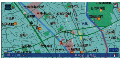
「ここです!メール機能」を使えば、「iMapFan」で検索した無線スポット情報を、カーナビに表示することが可能!