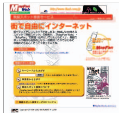
「MapFan Web」の無線スポット検索サービスのページ。 http://www.mapfan.com/musen/