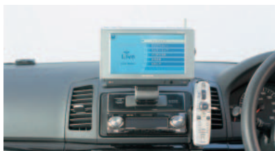
パイオニアのカーナビ「AirNavi」。国内初の通信機能内蔵カーナビだ。価格は月額3,980円(ボーナス時15,000円)など、さまざまなプランがある。 URL http://www.air-navi.com/

「iMapFan」で、無線スポットを検索してそれをカーナビに表示。目的地に設定して、ナビゲーションに従って、無線スポットまで行くという使い方もアリだ。