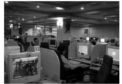
看板こそまんが喫茶でも、中身はほとんどインターネット喫茶。そのうち専門店も登場するのでは!?