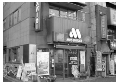
編集部から一番近い無線スポット、モスバーガー市ヶ谷田町店。無線の利用状況は今ひとつか?