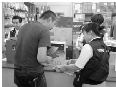
VAIO購入!その前に、レジのお姉さんからメモリー割引チケットをもらいました。