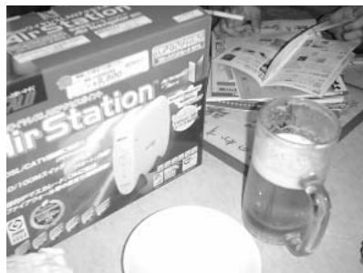
パソコン買ったぞパーティの模様。ちなみに、このメレコのルーター、酔っぱらって激しく落としてしまいました。