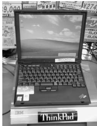
魅惑のThinkPad。もっていると、女の子にもてるんだろうな、と思いながらも、グッとガマン。

実は、最初に買ったノートPCがマッキントッシュDUO210。このVAIO、なんか同じ香がするのです。ということで、コイツの最大のウリは、青春時代を一緒にすごしたDUOを思い出させ、甘酸っぱい気分にしてくれる機能ということに決定!(kochi-j)