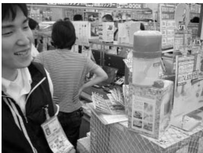
「いまLaVieを買うとかき氷機が付いてきます!」と叫ぶ店員さん。パソコンとかき氷、そのころは?