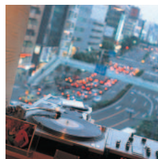
窓からは青山通りが見わたせる。夜はDJの音楽と美しい夜景に惹かれるお客さんが多い。