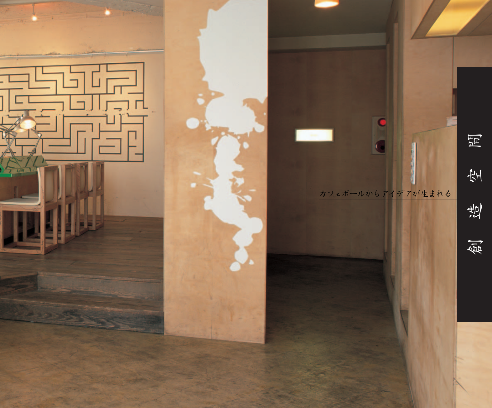
カフェボールからアイデアが生まれる