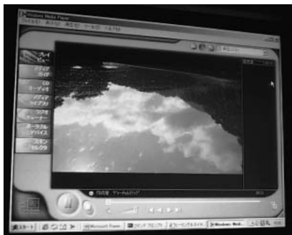
ウィンドウズメディアプレーヤーで再生している