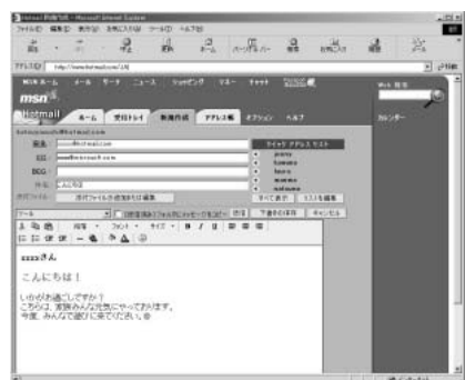
クイックアドレスで新規作成。