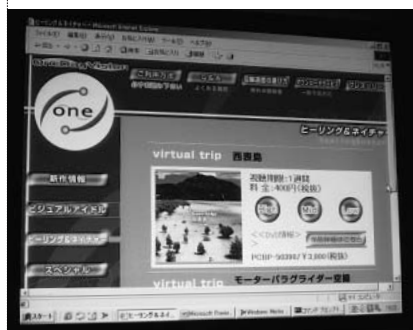
環境に応じた画質が選べる