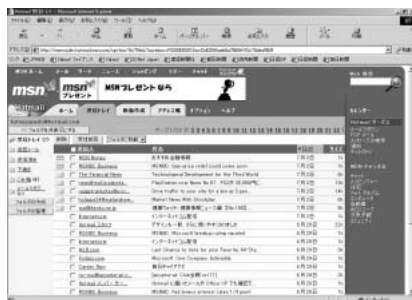
フィルター機能で迷惑メールを受信拒否できる。