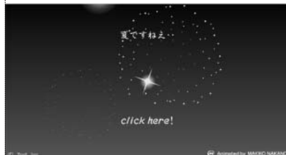
海中見舞いにびったりのeカード