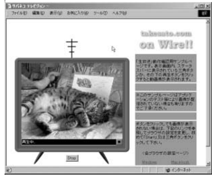
生放送中。家のペットを中継すれば心配いらず。