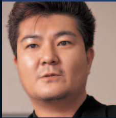
石井 浩一 (いしい・こういち) ファイナルファンタジーXI 開発 ディレクター。ファイナルファン タジーXIの開発をディレクター として陣頭指揮する。