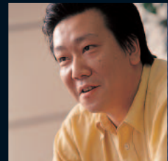
田中 弘道 (たなか・ひろみち) ファイナルファンタジーXI 開発プロデューサー。PlayOnlineプロジェクトで最初のキラーコンテンツとなる「ファイナルファンタジーXI」の開発を総指揮。

魅力のあるゲームは、「やめろ」と言われてもやめられないぐらい「中毒性」があるはず。