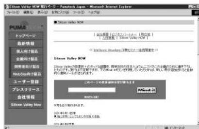
「Mind-it」ボタンを設置したウェブページの例