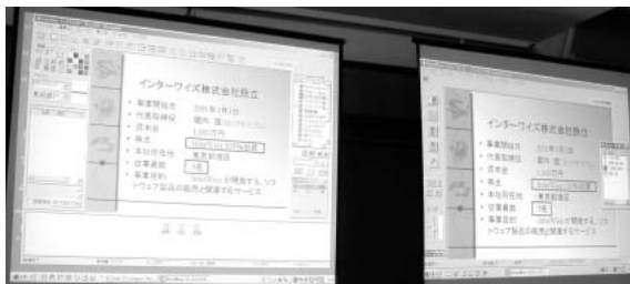
左が講師側画面で、右が生徒側画面。リアルタイムに画面を共有している。

従来のオンデマンド方式のeラーニングとは違い、InterWiseは異なる拠点にいる講師と複数の生徒とが画面を共有しながらリアルタイムにやりとりする「バーチャルクラスルーム」で授業を進める。生徒側の画面には、質問ボタンや挙手ボタンがあるので、これを押すことで講師とやりとりできる。これにより双方向性と同時性が増し、高い学習意欲を