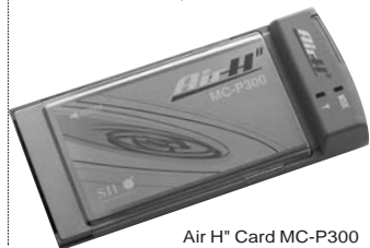
Air H Card MC-P300