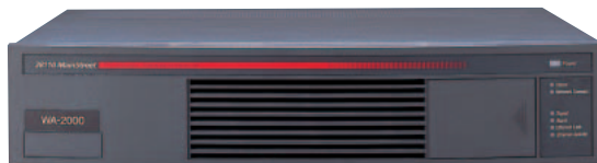
室内装置（上）は432×374×89mmとビデオデッキ程度の大きさ。アンテナ（右）は直径258mmで屋上やベランダなどに設置される。