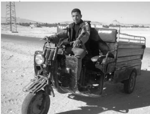
3輪のタクシー。2日間ほとんどチャーター状態で遺跡を見て回ったのにわずか7ドルだった。運転手の少年はまだ幼さの残る16歳。

ーターして700円、ラクダは1時間乗っても400円。シリアに来るならぜひラマダン中をお勧めします。さて、中東に来た旅行者の間で気を遣うのが“イスラエルとの関係”。聖地エルサレムを奪われた恨みはまだまだ根深く、パスポートにイスラエルの入国スタンプがあると中東諸国へは入国できません。でもこれには公認の裏技があって、イスラエルに入国するときはパスポート以外の紙にスタンプを押し、痕跡を残さずに中東へ入ることもできるのだとか。ちなみにツーリストがイスラエルの話をするときは「ディズニーランド」という隠語を使います。そのココロは「みんなが一度は行ってみたがる」ところで、中に入るとなんでも高い」からだとか。だれが考えたか知りませんが、なかなかユニークなアイデアですよ。さて、このあとはヨルダンに下り、紅海を渡ってエジプトへ。それでは来月、またお会いしましょう！