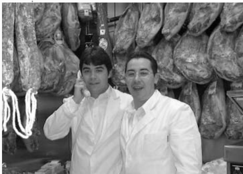
豚の脚のくんせいがゴージャスに壁を飾る中央市場のハム屋さん。電話中なのにおじいさんとボーズをとってくれるところがニクイ。