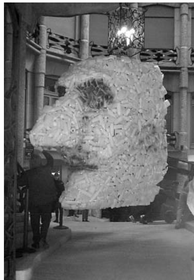
バルセロナの有名な建築「カサ・ミラ」を見にいったら、入り口と同じサイズの巨大な顔を発見。近くに寄ってみたら全部ポリ容器でできていた。

最後に訪れたタラゴナではお週に何度か大きな市がたち、食器や雑貨が格安で売られています。衣類の屋台に紛れたペット屋さんではホカホカの仔犬を売ってるのを発見。そういえばこの町ではひとときわたくさん犬連れの人を見かけましたが、そのわけは、市が立つたびにこんなカワイイ仔犬を売ってるからにちがいない