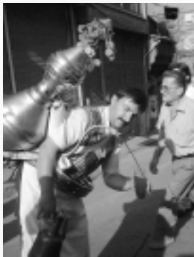
イスタンブールの街角で見かけたチェリージュース屋さん。おじぎして背中に背負った銀の壺から器用にジュースを注ぐ。

さて、イスタンブールは海に面しているので海産物がたくさん食べられます。特に有名な