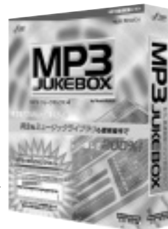
MP3 JUKEBOX 4 by MusicMatch