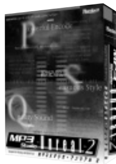
MP3 Studio Unreal2