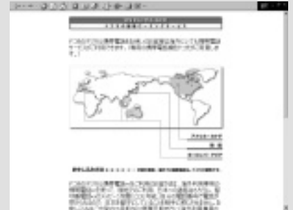
ドコモの国際ローミングサービス

URL http://www.nttdocomo.co.jp/products/service/keitai/guide/service/w_walker.html