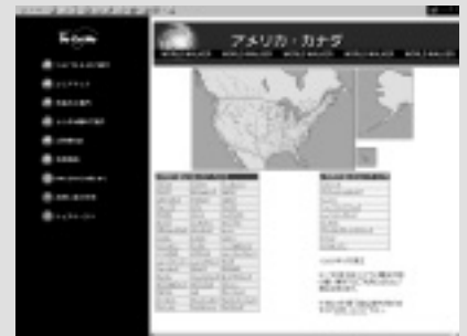
下記URLでは、利用可能エリアについても詳しいデータが掲載されている。

URL http://www.nttdocomo.co.jp/products/service/keitai/guide/service/w_walker.html