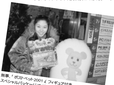
無事、「ポストペット2001」(フィギュア付きスペシャルパッケージ)をゲットできました!

意志を持って行動し始めた機械「ひみつメカのシゴ」。ナゾの力で動作する。普段はコンピュータだが、たまに変形したりバリアーを張ったりする。 ©Sony Communication Network Corporation All rights reserved.