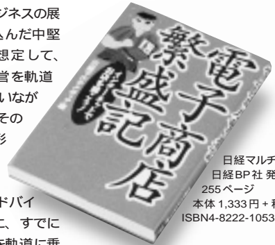
日経マルチメディア編 日経BP社発行 255ページ 本体1,333円+税 ISBN4-8222-1053-7

本書は、『日経マルチメディア』に連載されていた「デジタル・ビジネス実践講座」に書き下ろしの原稿を加えてまとめたものだ。全10章がそれぞれ連載1回分に当たる内容なので、読みやすい量にまとめられている。理論的な解説がないぶん物足りなさもあるが、肩の力を抜いて誰にでも読める入門書としての使命を十分に果たしている。