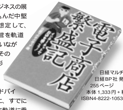
日経マルチメディア編 日経BP社発行 255ページ 本体1,333円+税 ISBN4-8222-1053-7

本書は、『日経マルチメディア』に連載されていた「デジタル・ビジネス実践講座」に書き下ろしの原稿を加えてまとめたものだ。全10章がそれぞれ連載1回分に当たる内容なので、読みやすい量にまとめられている。理論的な解説がないぶん物足りなさもあるが、肩の力を抜いて誰にでも読める入門書としての使命を十分に果たしている。