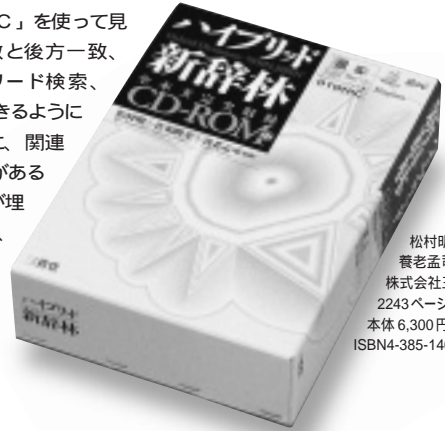
松村明、佐和隆光、養老孟司監修 株式会社三省堂発行 2243ページ+CD-ROM 本体6,300円+税 ISBN4-385-14026-X

画像や音声を含んだマルチメディア辞書ではなく、文字情報が中心の辞書だが、CD-ROM内の情報からインターネット上の情報につなぎ目なしに移れる機能は目新しい。CD-ROMはウィンドウズとマッキントッシュに対応する。