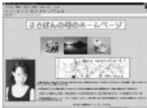
エッセイが楽しい「まさぼんの母のホームページ」

ロックとマックが大好きな、赤帽アラブヤ運送のホームページです。まだ立ち上げたばかりですが、「アラブヤのおすすめするロックの名盤」のページ(私の血となり肉となったクラシックロックをレビューするコーナー)には、力を入れていきたいと思っています。(内田洋一さん)