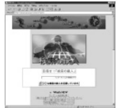
「検索の鉄人」のウェブサイトには出題された問題や解答の ノウハウ、決勝大会のレポートなども掲載されている。98年 開催予定の第2回大会の出場を担う人には要チェックだ！ URL http://tetsujin.arena.ne.jp/contents/top.html