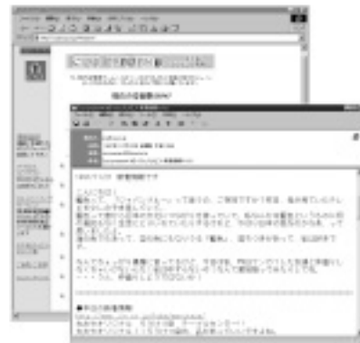
メール配信サービスはWEBページで申込みができる URL http://csj3.csj.co.jp/Present/