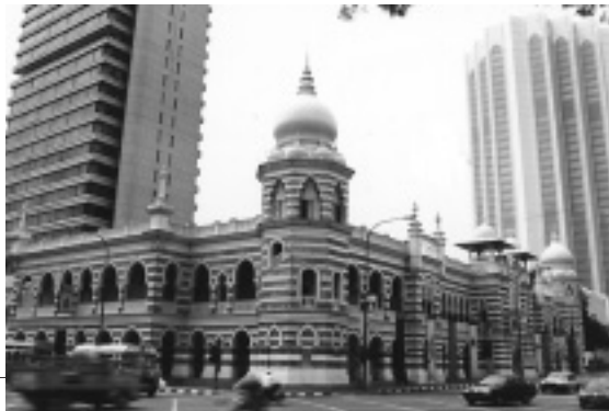
お正月でも普段とまったく変わらないIKL(クアラルンプール)の街角

さて、Jalan Jalanもホームページを立ち上げて1年が経つ頃には、繰り返しメールのやりとりをする常連さんのような人たちが増えてきた。