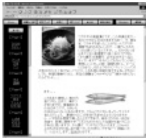
釣った魚の美味しい食べ方も紹介

釣りをしない方、食べることにしか興味のない方にも楽しんでいただけたらと思います。(Birdさん)