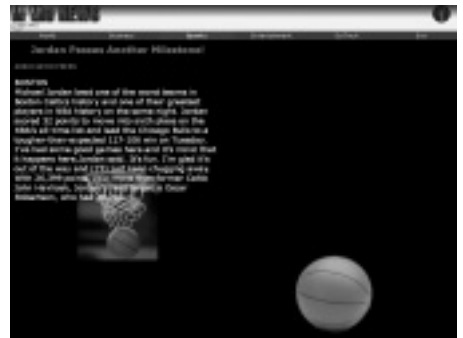
マイクロソフト社のチャンネルサンプル。ダイナミックHTMLがふんだんに使われている