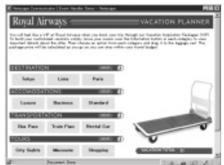
ネットスケープ社の「ROYAL AIRWAYS」のデモ。操作性に優れたインターフェイスをアピールしている