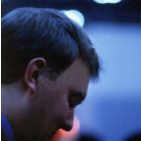
マーク・アンドリーセン Marc Andreessen