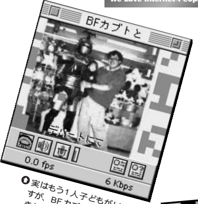
⑨ 実はもう1人子どもがいるのですが、BFカブトがこわいと大泣きし、逃げてしまいました。