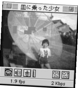
⑩ パラボラは直径240cmでタイの衛星に向けています。(田原さん)