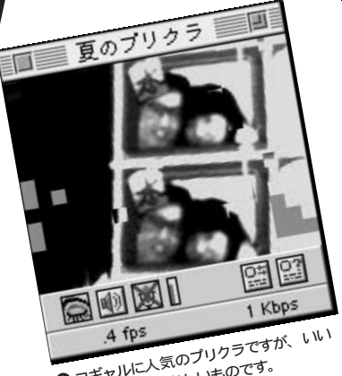
⑫ コギャルに人気のプリクラですが、いい大人でも結構楽しいものです。