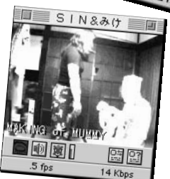
⑨ 前回二人羽織で笑わせたくれた2人は内容は不明だけど今月もパフォーマンス。