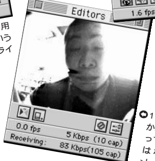
⑫ 1人がバンストをかぶったからといって君もやることはないんだよ。>kaotoka くん