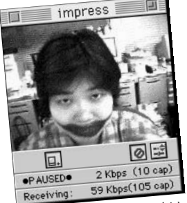
⑪ CU-SeeMeの日だからといってこの顔で廊下歩くなよ。>nisikido (私だ)