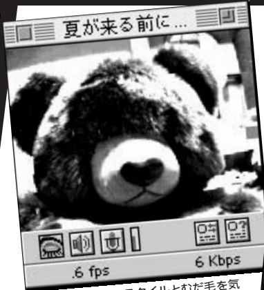
① 「夏に向かってスタイルとむだ毛を気にする彼女」あの～今日はホラー大会