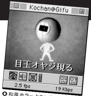
③ 和風ホラーともいえるネタ。Kochanはこの後同じネタの多さに絶句して①へ