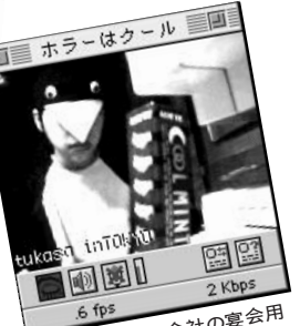
⑦ 初めてなのに会社の宴会用衣装をワザワザ借りたというのは恐い。じゃなくてエライ