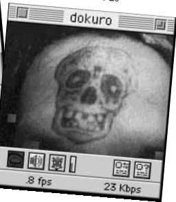
② 昔なつかしい「水転写のどくろマーク」を発見。