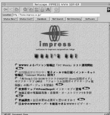
透明 GIF の画像例。 (「impress」のロゴ部分)

システムに侵入するために、許可されたユーザーとして振る舞うこと。本人であることを確認するためには運転免許証などの提示を求めるのが普通であるが、ネットワークではそれが不可能であり、本人認証の手段が限られている。そのため、セキュリティー対策の不十分なシステムでは、IPアドレスとパスワードを入手するだけで容易に本人になりすますことができる。