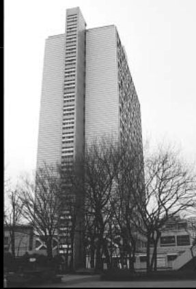
早稲田大学理工学部 プロフィール 所在地 東京都新宿区大久保3-4-1