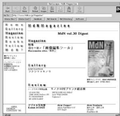
Netscape2.0のフレーム (frame) 機能

相手を激高させたり侮辱したりすることを目的に発信する電子メールのメッセージ、あるいはUsenetニュースグループの投稿記事のこと。フレームを発端とした罵り合いをflame war (フレーム戦争ともいう) というが、ニュアンスとしては中傷合戦に近い。また、Netscape2.0から追加された機能として、1つのウェブページをそれぞれ分割してブラウズできるフレーム (frame) という用語もある (「flame」とは意味もスペルも異なる)。