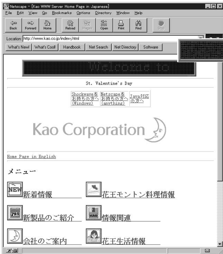
花王のホームページにアクセスすると、まず JAVAを使ったウェルカムメッセージが目を引く