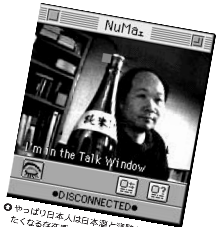
③やっぱり日本人は日本酒と演歌だ、と言いたくなる存在感。シブい。