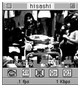
⑥「ログインしていることを忘れて焼き食べてました」ということです。