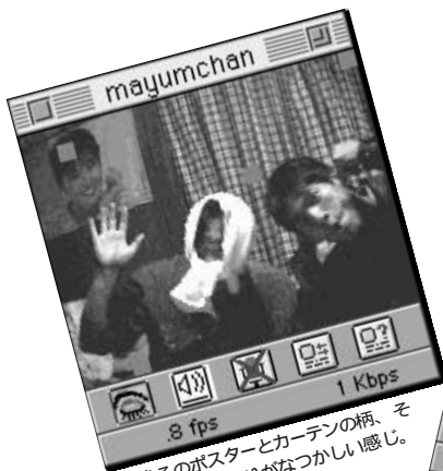
④後ろのポスターとカーテンの柄、そしてほっかむりがなつかしい感じ。