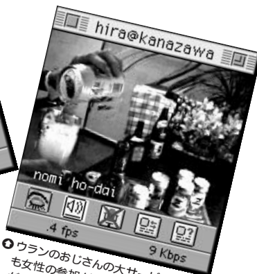
⑤ウランのおじさんの大サービス。今日も女性の参加が少ないと言っています。