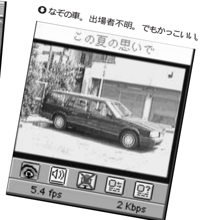
◎なぞの車。出場者不明。でもカッコいい