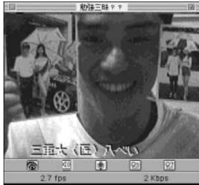
◎夏の間、身を粉にして勉強に励んだことが一番の思い出(三重大学)。さぞかし人生の肥しになったことでしょう。