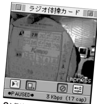
◎7年ぶりにラジオ体操に出ました。最近のカードはおしゃれになった。(uchiya-m)