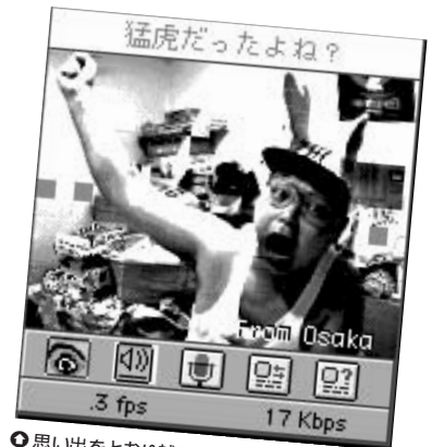
◎思い出をとおりに越して悪夢だったタイガースの絶不調!野田投手戻って(ばたりろさん)