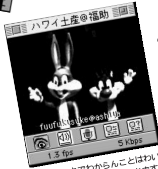
◎ワイキキでわからんことはいかに訊き。(芦屋の福助でございます)