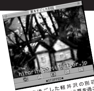
◎夏を過ごした軽井沢の別荘(hirarin)。1度そういう夏を過ごしてみたいなあ。