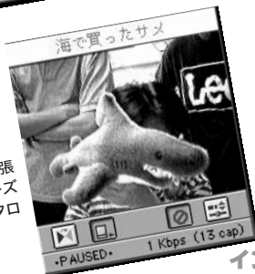
◎海はやっぱり幕張の海。ウィンドーズワールドにインタロップ...