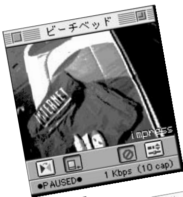
◎目を閉じれば幕張の喧騒も波の音に聞えるわ(N+1 RealTimes記者)