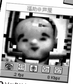
●ソックリさんだったら優勝だがこれはどう見ても。