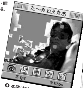
●本業はボディビルダー。肉体はシュウちゃん似てるのかも。