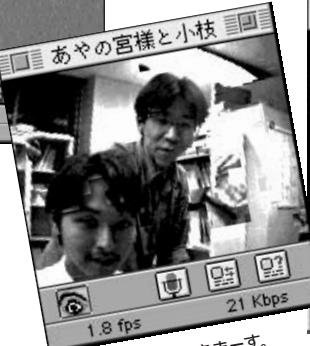
●三重大2本目行きませう。小枝って誰よ?