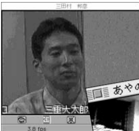
●今月、三重大の本命はこの人。巨人の桑田に似てるって声あり。