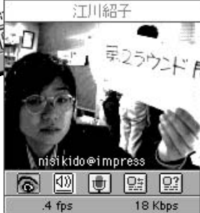
●最近、化粧がうまくなったと言われ、カメラ目線にもなれたつもりです (似てなくてごめん)