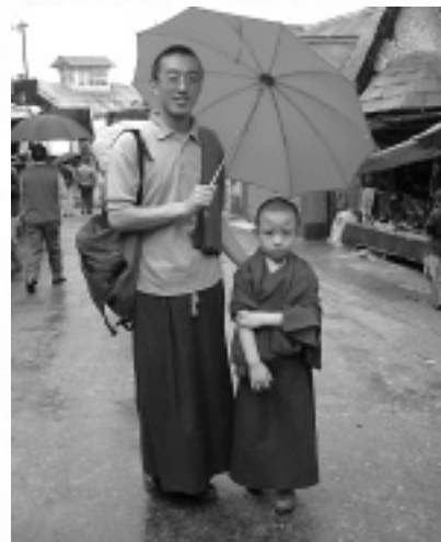
地理的にチベットにも近いので、ダーズリンにはチベット僧が多い。写真はリンボチュエと呼ばれ、高僧の生まれ変わりとい信じられている少年僧。

建築中のビルの横のゴミ捨て場で、ヤギと豚とヒトがあらそってゴミをあさる街カルカッタ。人力車の呼び声やクラクション、いまにも火を噴きそうなエンジン音が四六時中絶えることのないこの街にはまさに「喧噪」という言葉がぴったり。インド全土がそうなのかわかりませんが、少なくとも