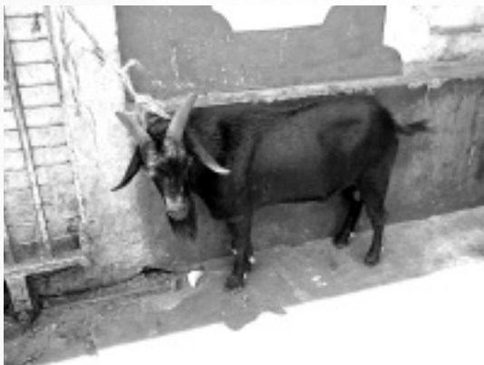
カルカッタのカーリー寺院では毎日生け簀のヤギが捧げられる。このヤギも間もなくクビをはねられる運命を知って知らず知らずうなだれていた。

俳優はなぜかマッチョなおじさん、ヒロインにはために近いグラマラスな若い女優という組合せのラブロマンスが人気ようです。ご存じの方も多いでしょうが、インド映画って突然脈絡なくダンスが始まったりしてめちゃくちゃ面白い! でも私が観に行った作品は、ハリウッド映画をツギハギにつないだようなストーリー。最初のシーンは「ターミネーター2」そっくりで、展開は「アサシン」そっくり。よくクレームがつかないもんだ。ちなみにインド人の映画好きは有名ですが、インド映画の「クチュクオタエ」は全土で前代未聞の興行記録を達成。ついにタイタニックもその記録を塗り替えることはできなかったとか。