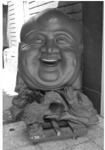
台中にある寶覺寺の笑い布袋尊。木の根に彫つたらしい巨大な頭がお寺の売店の入り口にどっかり。

そんな台湾で唯一苦労したのは、大きい街での宿探し。叔母と別れて1人になると、いつもどおり駅前などで宿を探しますが、「住宿」(宿泊)の下に書いてある「休息」っていうのは..もしかして「ご休憩」のこと？ ある宿で受付のおばさんに「ここはね、1人で来ると