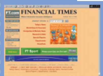
① 英国の経済紙『ファイナンシャル・タイムズ』 http://www.ft.com/ 無料の会員登録が必要。

しかし、そんなオフショアのメリットが万人に開かれていては、世界中で税金を払う人が激減してしまうだろう。実は米国の市民権がある人などは、基本的にオフショアに投資することはできない。つまり、これまでオフショアを利用して来た個人とは、英国人の非英国居住者、英国以外のヨーロッパ、中南米やアジアの富裕層が中心だった。法的な規制以外に日本でオフショアが知られてこなかった大きな理由は、こんなところにもある。金融ビッグバン時代を迎えた今、日本人もそのメリッ