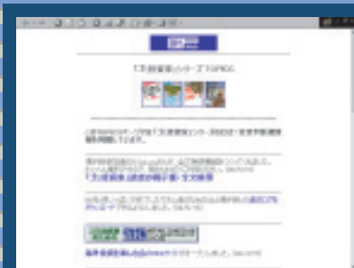
②書籍『ゴミ投資家』シリーズ http://www.mediaworks.co.jp/alt/bigban/topic_s.html 掲示板が活発で初心者にも為になる

「海外投資を楽しむ会」(*2) http://www.alt-invest.com/links/index.html オフショア銀行の口座開設情報ならここ