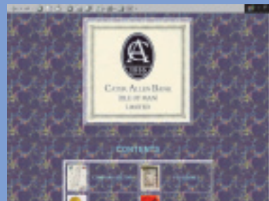
③ケイター・アレン銀行(マン島) http://www.caterallen-bank.com/ オフショア銀行の一例