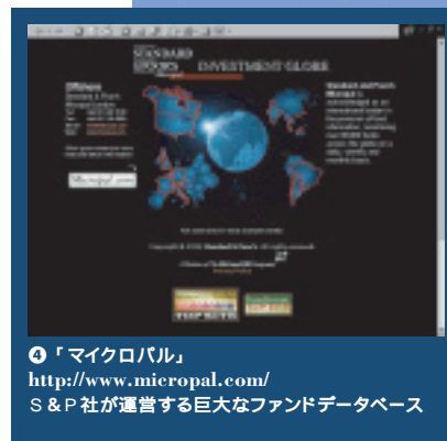
④「マイクロパル」 http://www.micropal.com/ S&P社が運営する巨大なファンドデータベース

次にファンド運用会社は、特に初心者の場合には伝統があって名前が知られているところを選ぶのが望ましい。大手で、ファイナンシャル・タイムズに掲載され、さらにコンスタントに10%台の利回りを出しているものだけでも数百種はあるだろう。あとはマイクロパルなどのデータベースで、格付けを参考にすることになる。その際は、たとえば「リチャード・ナッシュ・アンド・マネージャーズ」など個人の名前を前面に出しているようなファンド