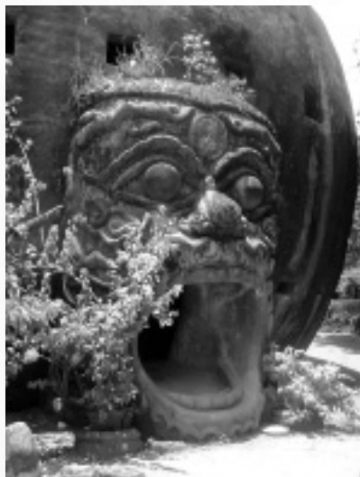
バラモン僧ルアンブーによって作られたブッダパークのオブジェ。前衛的でちょっとブキミなモチーフが印象的。

ビエンチャンの見所はかるうじて、金ピカの仏塔と凱旋門ふの建物がある程度。でも仏塔の金ピカはただのペンキみただし、凱旋門に至っては、いかにも途中で予算が尽きたような外側むき出しのコンクリート。凱旋門は内部に入れますが、中途半端な装飾を見ながら