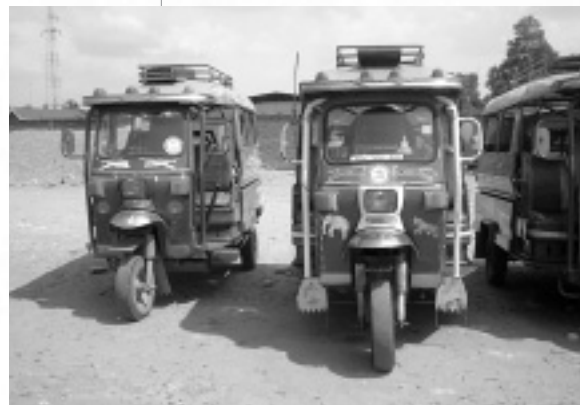
トゥクトゥクと呼ばれる三輪タクシー。うまく交渉すれば1km10円くらいで乗ることができる。

ラオスでのおすすめは「メコン川下り」。歴史の浅いラオスではこうした自然こそが観光客を呼ぶ目玉になってるんですね。タイ国境の町フエサイから、世界遺産の町ルアンパビンまでは8人乗りのスピードボートで約6時間。兩岸はごつごつの岩肌。かなり見応えありそうな風景です。ところが出発前にライフジャケットを着せられて、ひとによってはこの暑いのにフルフェイスのヘルメット。それって岩に激突して転覆したりするかもしれないってこと!? そんなことになったらパソコンが壊れてしまう! と考えてから自分のアホさに気づきました。パソコンよりも命の心配せねば。途中は結構難所も多く、ボートはしばしばたきつけるように揺れました。タオルと服で何重にも巻いている