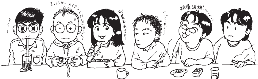
まぐまぐを支えるのはこんな面々だっ！