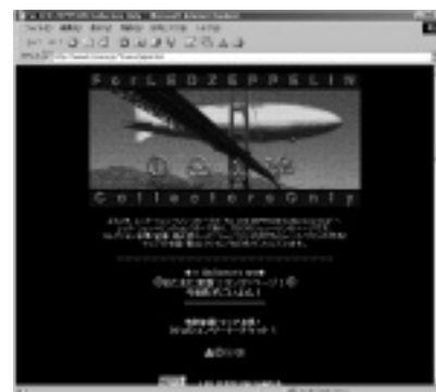
「FOR LED ZEPPELIN COLLECTORS ONLY」

< Interview & Text by 鈴木康之 > URL http://www.asahi-net.or.jp/~hh5y-szk/