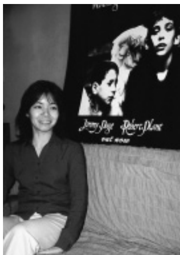
「某所から奪ってきた(笑)」という、宣伝用のパネルと一緒に。

新しい手法とか出てくると、使ってみたいなと思います。レイアウトも、他のページでカッコイイのがあると真似しちゃおうかなと思ってぱっと変えたり、何度も見やすくする方法を考えたりとか。最初のうちは試行錯誤ばかりして、ぐちゃぐちゃになったりしてました(笑)。今はJAVAとか使ってやってみたいなと思っています。プログラム言語だから難しいだろうなとは思っただけど、やってみたいなという興味はすごくあります。野望は燃やしているんですけど、なかなか進まないのが現状ですね。CGIも本を見て自分でやったり、何でも自分でやってみようかな