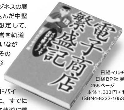
日経マルチメディア 編 日経BP社 発行 255ページ 本体 1,333円+税 ISBN4-8222-1053-7

本書は、『日経マルチメディア』に連載されていた「デジタル・ビジネス実践講座」に書き下ろしの原稿を加えてまとめたものだ。全10章がそれぞれ連載1回分に当たる内容なので、読みやすい量にまとめられている。理論的な解説がないぶん物足りなさもあるが、肩の力を抜いて誰にでも読める入門書としての使命を十分に果たしている。