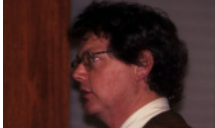
ビル・ジョイ Bill Joy

JavaやJiniは分散オブジェクトのアーキテクチャで、それも21世紀向けのネットワークに向けた私たちの提案です。私たちはシステムをシンプルにしようとしています。シンプルなものこそ信頼性が高いと信じているからです。そしてもっとパワフルであると考えています。非常にシンプルなメカニズムを少量使って、すべてが理解しやすいものとなっています。難しいプログラミングは必要ありません。難しいものは適切な部品さえ集めれば非常に簡単になります。