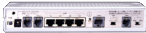
写真左から、電源入力端子、アナログポート2つ、10BASE-Tポート4つ、アース端子、S/T点、DSU切り離しスイッチ、U点、極性反転スイッチ。