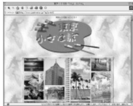
東京小さな旅 - Tokyo Journey - URL http://www.asahi-net.or.jp/~by3s-fet/

< Interview & Text by 鈴木康之 > URL http://www.asahi-net.or.jp/~hh5y-szk/