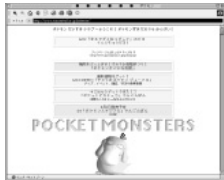
「ポケモンだいすきクラブ」

「マザー2」が出てから4年くらいになるんだけど、海外にはいろんなページがあるのに、日本には全然ないんで作っちゃったんです。なにか思いついたら、すぐにやっちゃうんですよ。ポケモンのページではなるべく表に出ないようにしていますが、