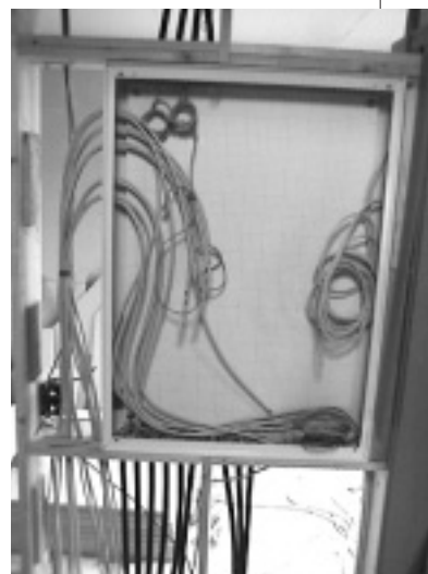
この中にブースター、分配器、モデム、ハブ、DSUなどが入る。

急に思い立ってこの配線の導入を始めたものの、事前の打ち合わせは本当に大切だと実感した次第。今回は機器の設置です。