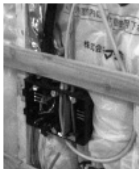
LAN, ISDN, TV, CATVと電源。このセットが9カ所に付く。

いりえまこと 銀座の広告代理店に勤務する43歳。ビデオ・パソコン・キャンプ・家族をこよなく愛するごく普通のオヤジ。E-mail mkirie@nks.co.jp