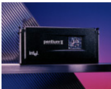
Intelが4月15日に発表したPentium® プロセッサ(350MHzおよび400MHz版) URL http://www.intel.co.jp/

まだまだ圧倒的に男性ユーザーが多いパソコン。パソコンに興味はあってもなかなかとりつきにくい、わかりづらい、という多くの女性のための「簡単!」「わかりやすい!」「楽しい!」ホームページがこの「My First パソコン」だ。インターネットからマスター術やデジタルを使いこなすステキな女性の紹介などを、毎週火曜日更新で連載中。また、本連載の「My First Question ~ どうなってるの?」の様もウェブ上で紹介している。