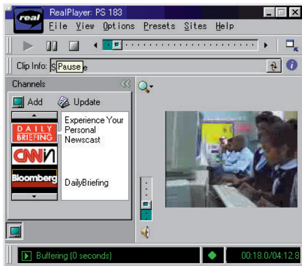
RealPlayer G2のインターフェイス