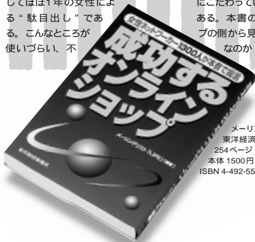
メーリングリスト「LIFE」編著 東洋経済新報社 発行 254ページ 本体 1500円 + 税 ISBN 4-492-55299-5

また、よく考えてみれば、消費者の要望を満たすショップがビジネス的に成功するショップとは限らない。売り上げを考えるならば、現在は女性の購買層より男性のほうを重視すべきだという意見もある。もっとも、消費者の要望に応えられないショップが成功するとは思えないので、成功するヒントは十分詰まっているはずだ。ただ、何かと女性にこだわっているのが気になるところである。本書の前提というべき“ショップの側から見たときの真の成功とは何なのか”が抜けているようだ。