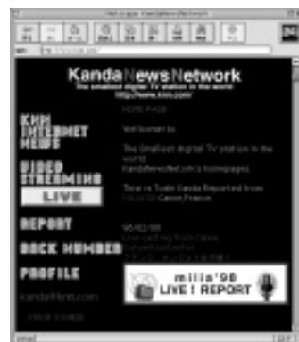
KNNのウェブサイト。インターネット関連ニュースやストリーミングコンテンツが満載だ。