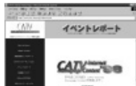
募集要項の詳細は上記URLに掲載

問い合わせ 地域マルチメディア・ハイウェイ実験協議会事務局 TEL 03-3264-2551 URL http://www.catv-inet.or.jp/