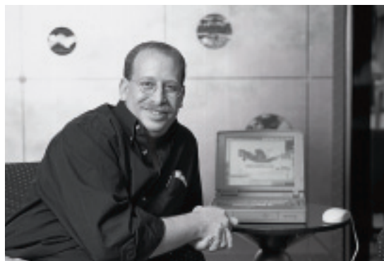
マイロウィッツ氏とDreamweaverの起動画面