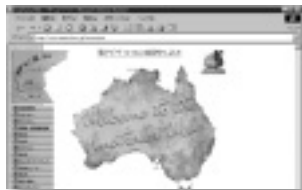
オーストラリアへの転職情報も掲載