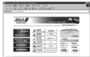
マイレージの照会もできるANAのウェブサイト