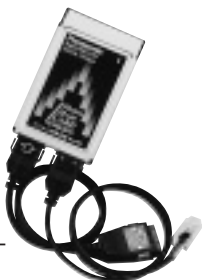
デジタル携帯電話と10BASE-Tのインターフェイスを搭載

問い合わせ 松下電器産業(株)P3カスタマーサポートセンター TEL 03-3834-2921