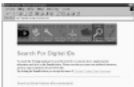
従来のWEBによるサービスも継続していく

URL http://digitalid.verisign.com/query.htm