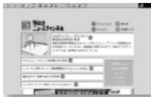
Watchシリーズの最新ニュースを随時配信

URL http://cast.watch.impress.co.jp/active/preview.htm