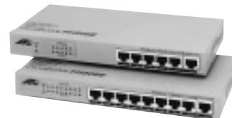
「CentreCOM FH505E」(上)と「CentreCOM FH508E」(下)