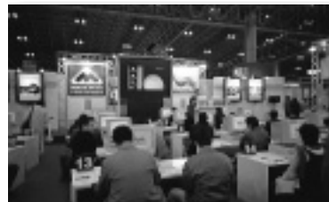
人気のマクロメディアの体験セミナーの様子

ショー会場にも、「Web Publishing Pavilion」というテーマゾーンが設けられており、ヤフー㈱やソフトバンク㈱など8社が展示を行っていた。しかし、1社ごとのブースが小さく、集客の面ではもう1つ、