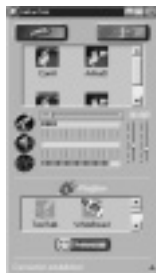
「インターネット・メイト」の操作画面

問い合わせ フォーカルポイントコンピュータ(株) TEL 03-5484-0140