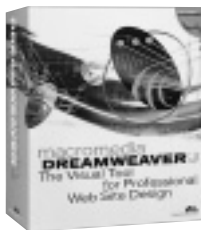
デザイナーなどのプロ向けウェブデザインツール

問い合わせ (株)アスキー TEL 03-5351-8652 (株)システムソフト TEL 092-752-5264 URL http://www.macromedia.com/jp/