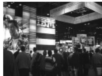
ニューヨークで行われたインターネットワールド97の展示会場

さらに、今後JDKがバージョンアップした際に既存のWWWブラウザに最適なJavaパーチャルマシンを自動的にセットアップするためのプログラム「Java Activator」を発表。これによって、JNI (Java Native Interface) や RMI (Remote Method Invocation) をサポートしていないインターネットエクスプローラ4.0や、JDK1.1以前に発表された古いバージョンのWWWブラウ