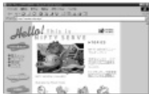
オンラインサインアップもできる