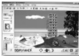
このような3Dを使ったページも簡単に作れる

問い合わせ NEC高度映像メディア開発本部 VR開発 ✉ vr@avm.nhe.nec.co.jp URL http://softplaza.biglobe.ne.jp/