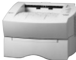
メモリーは標準で2Mバイト、増設は34Mバイトまで可能

問い合わせ 京セラコミュニケーションシステム(株)情報システム営業本部プリンタ営業部 TEL 03-3708-3871