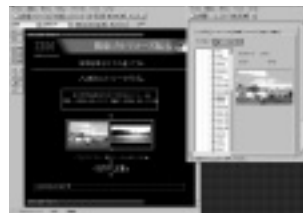
データベースとWEBの連動も簡単