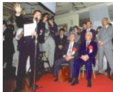
96年1月8日にラフォーレ原宿で行われた開会式。(以下写真は同書より)

今回、このエキスポの軌跡と成果をまとめた本『A World's Fair for the Global Village』がアメリカで刊行され、12月には日本語版も発売されます。このコーナーではインターネット史に残るイベントを記録したこの本の見どころを紹介します。