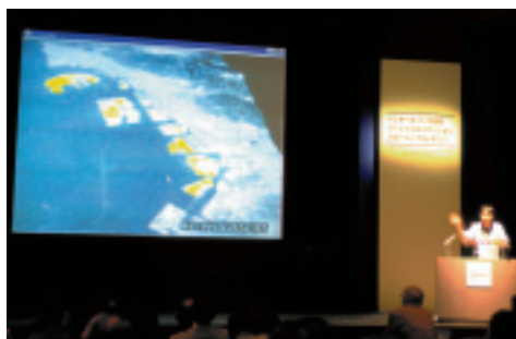
12月8日に神戸で開催されたエキスポクロージングセレモニー。