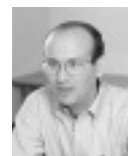
カール・マラムッド エキスポの創設者。『A World's Fair for the Global Village』の著者。現在は慶應義塾大学SFC研究所プロジェクト教授として日本に滞在中。